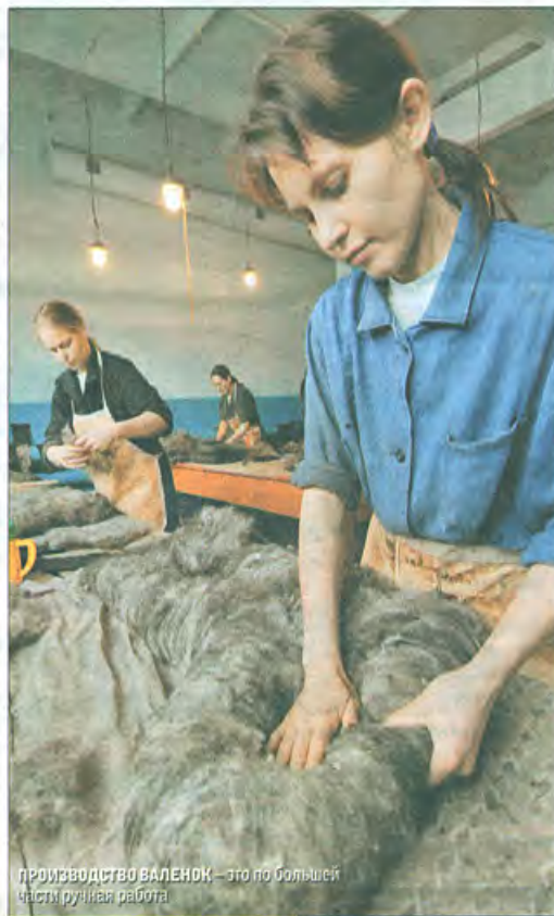
Производство валенок – это по большей части ручная работа

часами. Одни оупенно крутят большой деревянный вал чесальной машины с множеством маленьких валиков, из которых торчат шипы и иголки. На такой полтора века назад «причесывали» и обрабатывали овечью шерсть. Другие по валенкам изучают историю страны и быт первых лиц государства (см. бокс «История»). Третьи прикидывают, в каких моделях не будет считаться зазорным щеголять по улице.